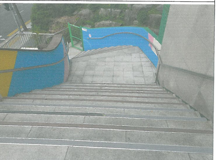
대체육관 외부 수영장 방향 주계단 눈슬립 미끄럼방지 사포테이프 보수시공작업