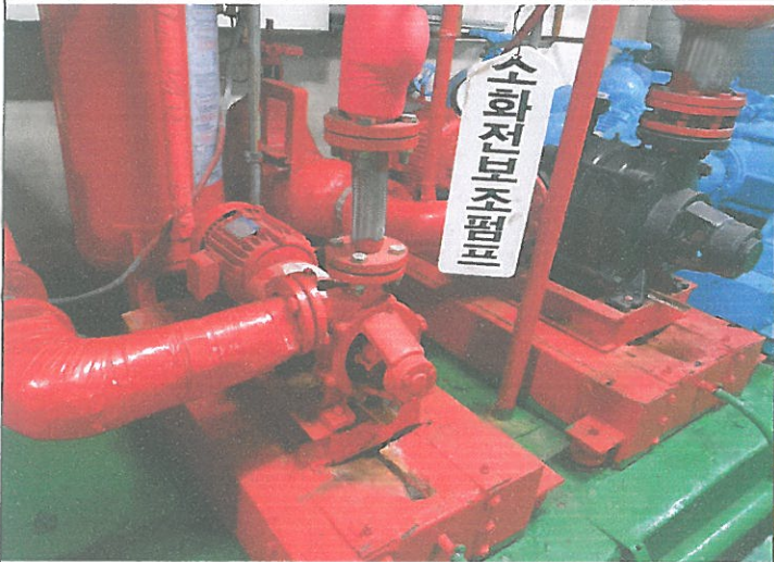
기계실 소화전 보조 펌프 구리스 바킹 교정