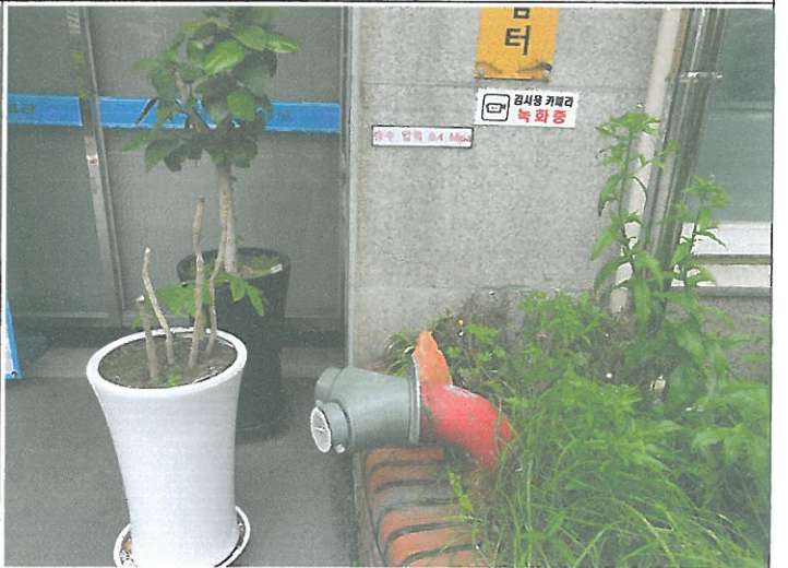
스프링클러 송수관 송수 압력 표지 교체