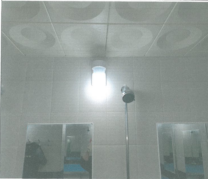
수영장 남자 샤워장 내 벽등 1개소 교체