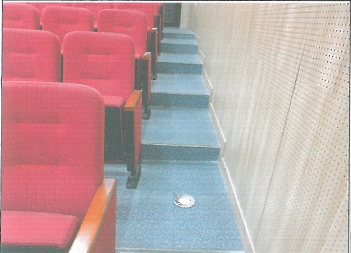
1층 청소년 극장 내 객석 유도 등 의자 방향으로 치우쳐 있어 시인성 낮음 위치 이동 조치 완료