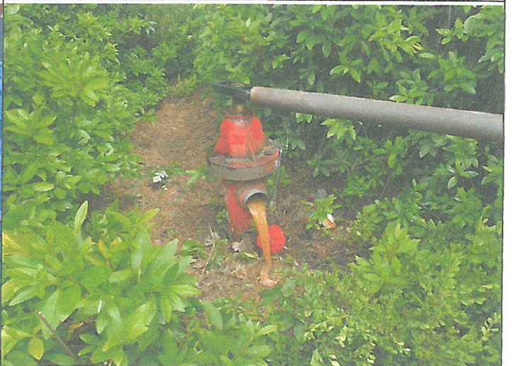
화단 옥외 소화전 벨브 작동 실험