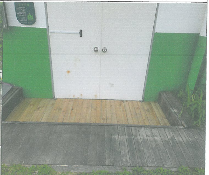
옥상 중앙 출입문 방부목 제 시공