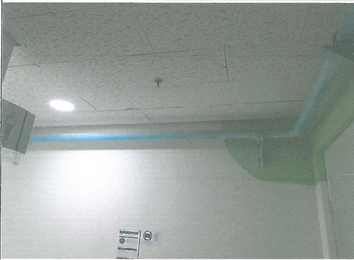
지하 1층 여자 화장실 천장 텍스 부착