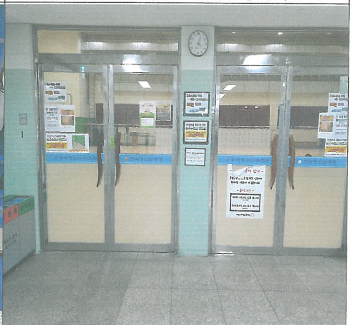
대체육관 출입 강화문 손잡이 탈락. 부착