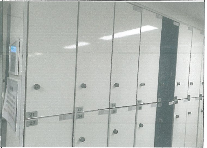
수영장 남자 락카실 21번 키뭉치 교체