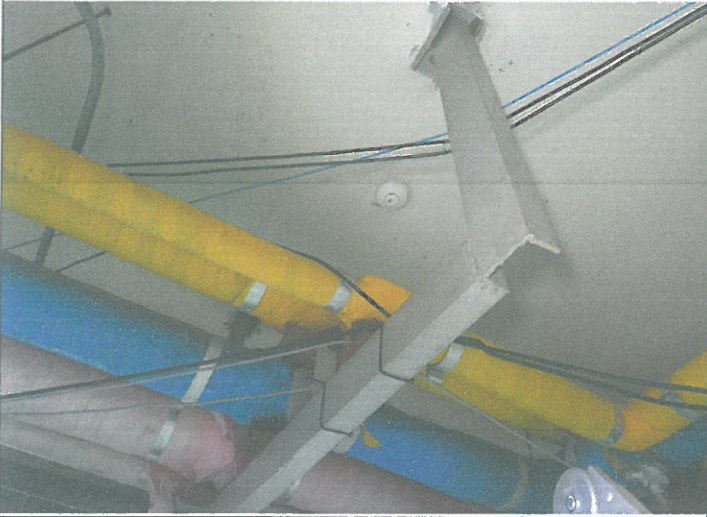
급탕 탱크 천장 열 감지기에서 연기 감지기 교체