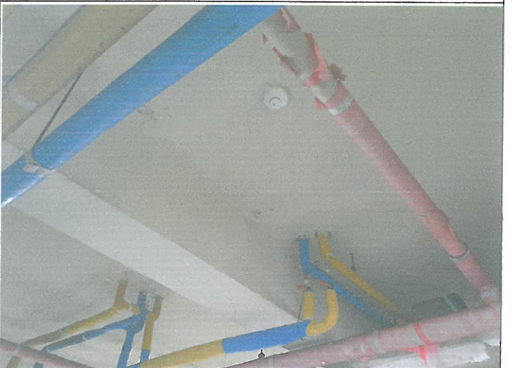
빙축열 천장 열 감지기에서 연기 감지기 교체