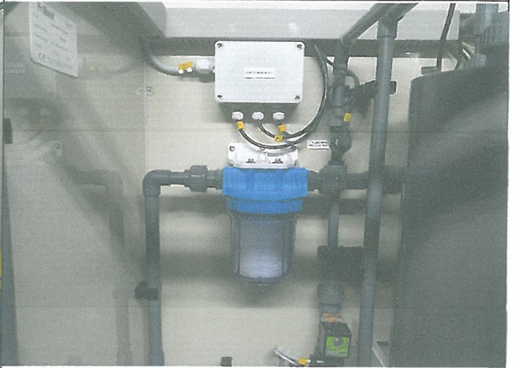
염소 발생기 물 필터 교체