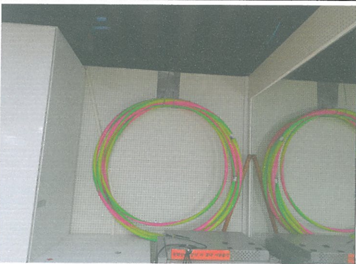
지하 1층 소체육관 훌라후프 걸이대 제작 설치