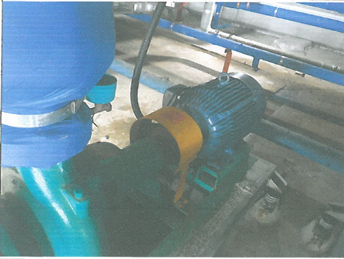
수영장 순환 펌프 2호기 모터 교체