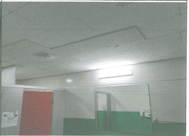
지하 1층 여자 화장실 천장 텍스 부착