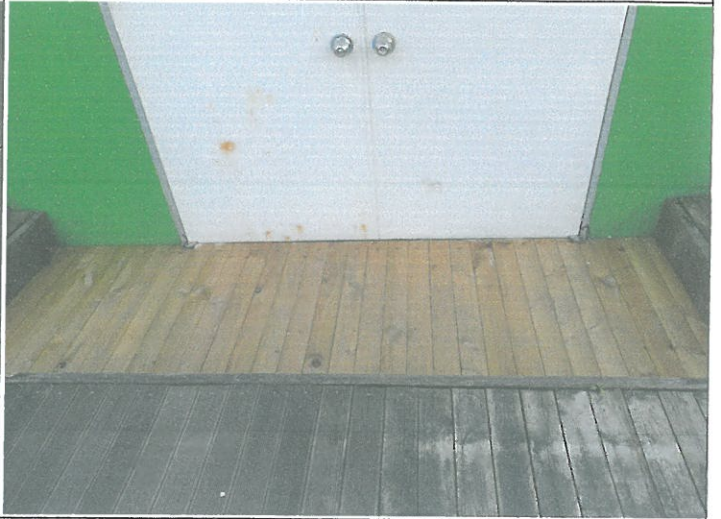
옥상 출입문 바닥 방부목 들뜸 교정