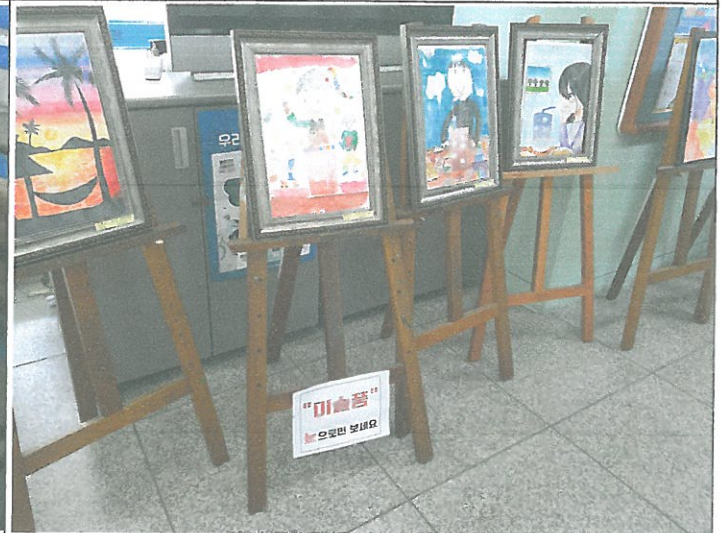
미술실(유스룸) 이젤 2기 고장 수리