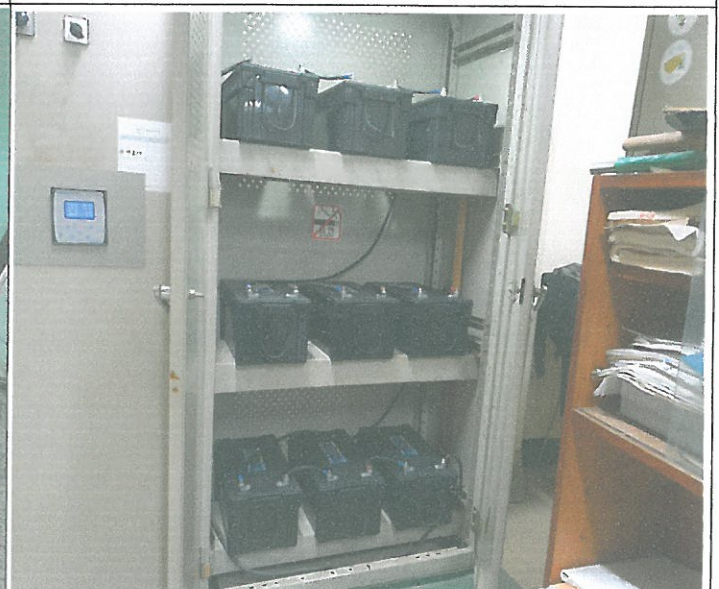
수변전실 비상용 배터리 교체