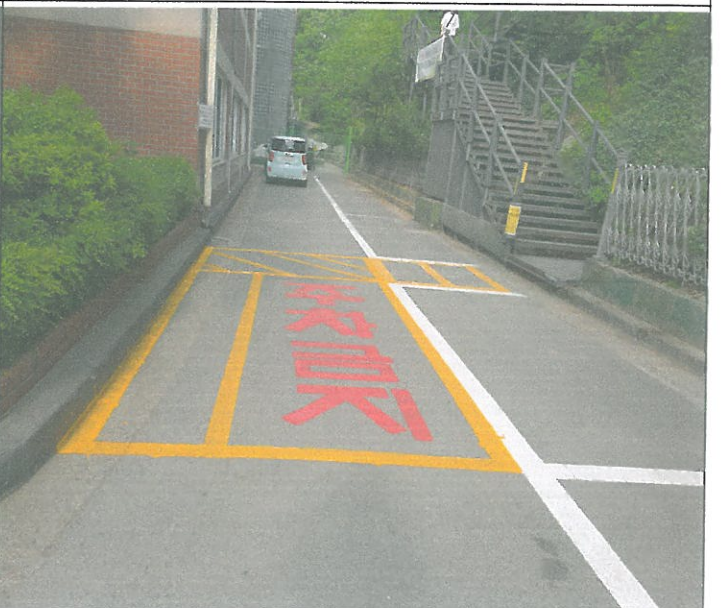
주차장 주차금지 도색