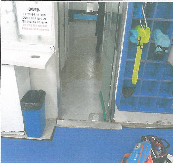
수영장 남자 샤워실 입구 강화문 H바 하단 안전리브 탈락 정비 부착