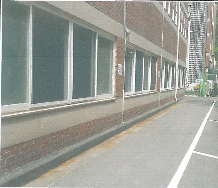
새들반.방과후아카데미.유스룸.평생교육팀 방충망 교체