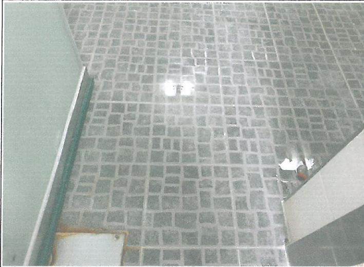
1층 대체육관 남자 샤워장 바닥 타일 탈락 되어 보수