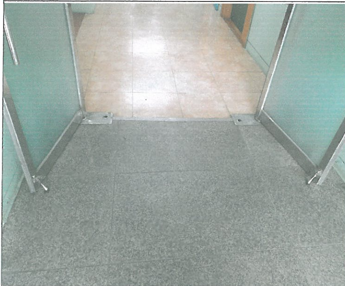
1층 주차장 방향 복도 강화문 말굽 탈락 부착