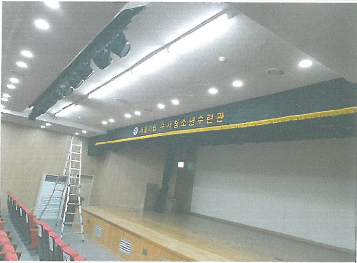
청소년 극장 무대 앞 천장 열감지 ~ 연기 감지기 교체 2개소