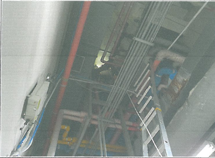
1층 여자 화장실 오수 배수 모 배관 말단 통수